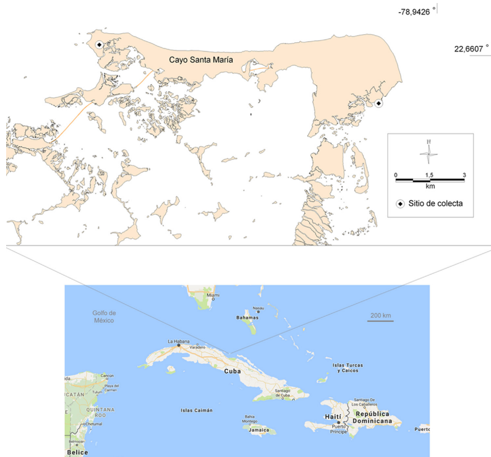
Figura 1. Ubicación del registro de Halophila ovalis en las Antillas Mayores.

dispersarse a grandes distancias, al considerar su bajo porcentaje de divergencia genómica. En esta nota se confirma su presencia por primera vez en aguas marinas cubanas, ampliando su rango de distribución en el Atlántico, a más de 1,800 km al noroeste del último reporte.