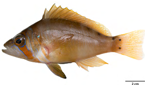
Figura 2. Hypoplectrus ecosur Victor, 2012.