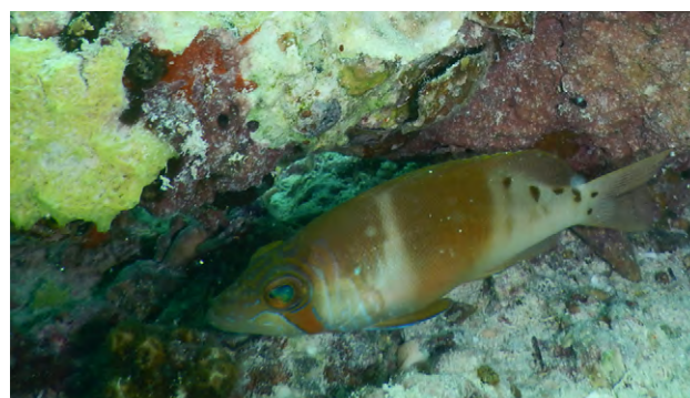
Figura 3. Fotografía subacuática de Hypoplectrus ecosur Victor, 2012, por Jacob Rubio-Molina, Laboratorio de Biología de la Conservación, UMDI-Sisal, UNAM.