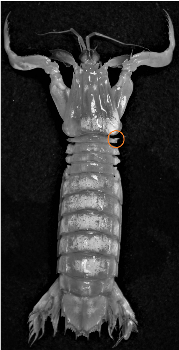
Figura 2. Ejemplar de Gibbesia neglecta con malformación en el proceso lateral derecho de la quinta somita torácica.

presencia de 5 dientes en el dactilo del segundo par de maxilípedos (o garra) como única característica compartida entre las especies (Ahyong, 2001). Por el contrario, el palpo mandibular está ausente en G. prasinolineata , el proceso lateral del quinto somita torácica es espatulado para G. neglecta y triangular para G. prasinolineata (Ahyong, 2001; Manning, 1969; Manning y Heard, 1997).